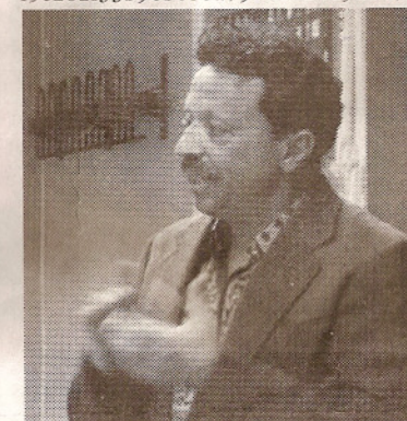
Ruso e israelí, escritor, traductor, periodista. Israel Shamir nació en Novosibirsk.

Fuentes: http://www.israelshamir.net/Spanish/Biography_sp.htm ; http://www.hebreos.net/debatir/web/viewtopic.php?p=169&sid=f5c282f33b96bc88179d6e024d9db47a